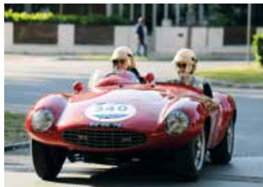
SOPRA MILLE MIGLIA SOTTO IRONMAN