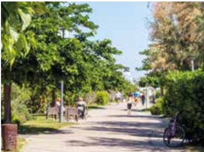
LUNGOMARE DI MILANO MARITTIMA

Zahlreiche Nuancen des Grüns färben Cervias Gegend. Diese Behauptung gilt nicht nur für die verschiedene Farbtöne, die von Smaragd- bis zu Hellgrün, von Moos- bis zum Waldgrün reichen, sondern auch für die Vielfalt an Bäumen und Gebüsch, die die herrliche Umwelt von Pinienwäldern, Parks und Gärten bilden, die sich zwischen Milano Marittima und Tagliata, auf einer Gesamtfläche von 5 Millionen Quadratmetern erstreckt. Der Pinienwald ist das ideale Ziel umweltliebender Reisender. Hier kann man entspannt das dichte Netz an Wander- und Fahrradwegen zurücklegen oder dem beschilderten Wanderpfad durch die Natur folgen; während der touristischen Saison werden außerdem geführte Touren organisiert. Absolut neu: Im Sommer 2022 wird das Forest Bathing, wortwörtlich das Baden im Wald, vorgestellt. Dieses Erlebnis gilt als eine Einladung, mit allen fünf Sinnen in die Natur einzutauchen. Zum Schluss spielen das Grün, die Pflanzen und die Blumen zweifellos die Hauptrolle bei Cervia Città Giardino, die Gartenausstellung im Freien, für die im Jahr 2022 das 50. Jubiläum gefeiert wird.