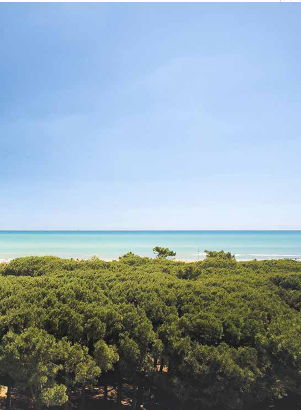
AEREA DALLA PINETA AL MARE