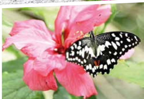
CERVIA CITTÀ GIARDINO, AL GOLF CLUB UN ESEMPLARE ALLA CASA DELLE FARFALLE

La quarta edizione della manifestazione si terrà dal 10 al 12 giugno 2022 e coinvolgerà alcuni dei luoghi più caratteristici e suggestivi della località.