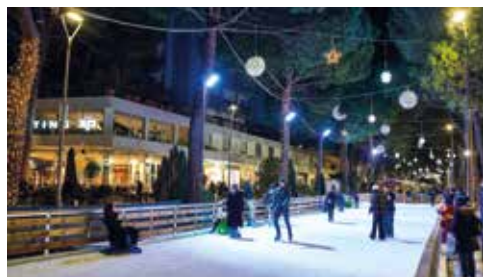
SOPRA DUE IMMAGINI DEL NATALE ILLUMINATO DI CERVIA, SOTTO LA PISTA E LE LUMINARIE A MILANO MARITTIMA

Il tempo delle Feste è diventato sempre più il tempo ideale per una vacanza relax e il mare d'inverno, con le sue atmosfere ovattate e i colori indefiniti nell'aria frizzante, una delle mete preferite per festeggiare il Natale e il Capodanno. Famiglie, gruppi di amici, coppie giovani e meno giovani, per tutti c'è una proposta suggestiva e tante iniziative di intrattenimento. Milano Marittima e Cervia diventano scintillanti villaggi di Natale, abitati da elfi e befanotti, si animano le piste del ghiaccio, aprono le casette dei mercatini golosi e il meraviglioso mondo di Babbo Natale.