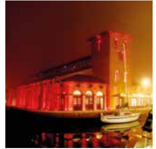
MUSA - BURCHIELLA