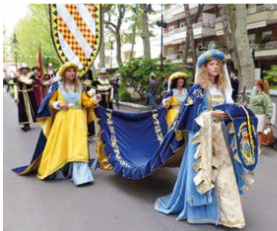
IL CORTEO STORICO DELLO SPOLAZIO DEL MARE