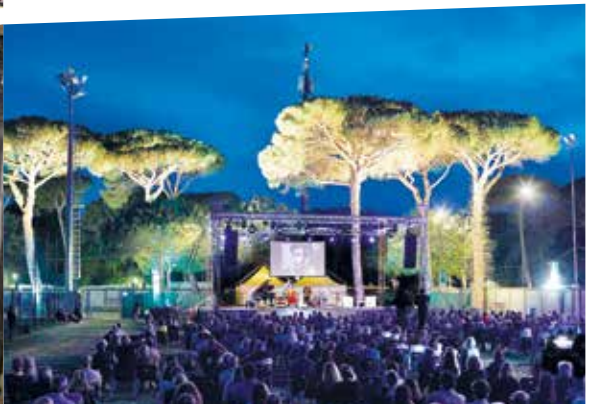
SERATA ALL'ARENA DEI PINI RASSEGNA DI TREBBO IN MUSICA DI RAVENNA FESTIVAL