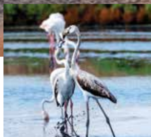
TRAMONTO IN SALINA E FENICOTTERI

dalle torrette e dai sentieri fenicotteri rosa, aironi, cavalieri d'Italia, avocette e l'attività della raccolta del sale, quel Sale dolce di Cervia così definito per il suo gusto delicato privo del retrogusto amaro di cloruri e fosfati. Tra le proposte più apprezzate l'esperienza di Salinaro per un giorno che Musa organizza per i turisti alla salina Camillone, unica vasca rimasta a raccolta artigianale.