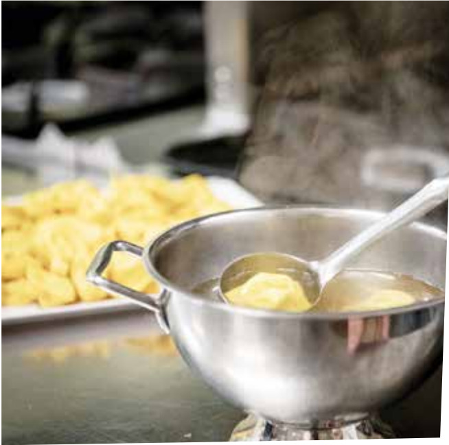
UNA FUMANTE ZUPPIERA DI CAPPELLETTI ALL'USO DI ROMAGNA A DESTRA IL CARDO DI CERVIA