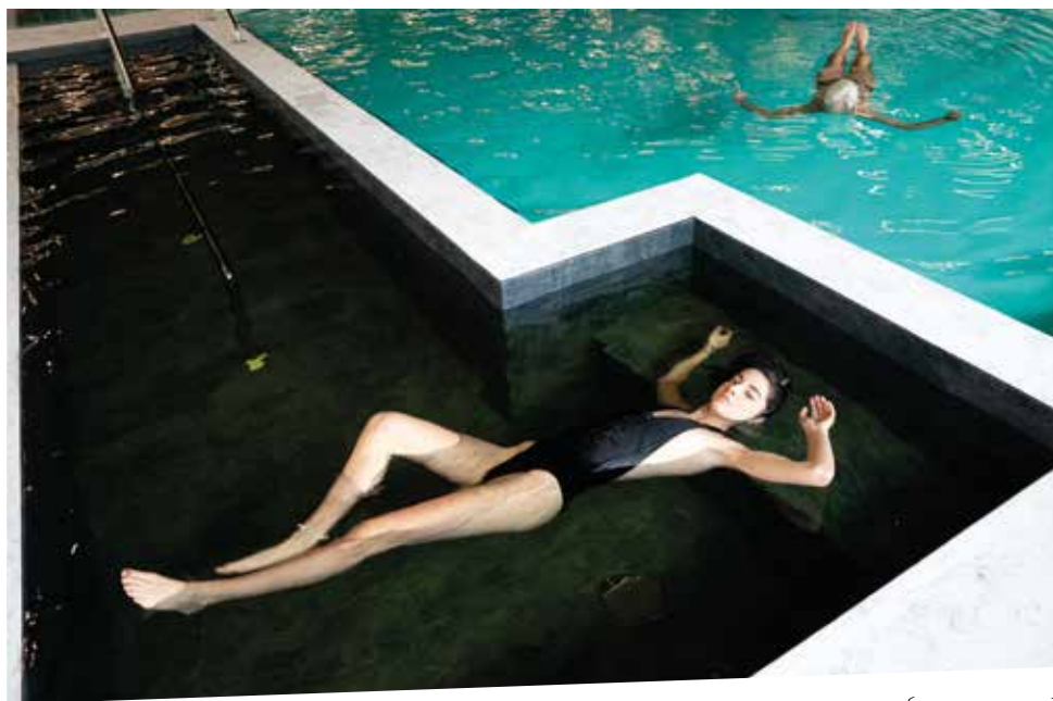
TERME DI CERVIA

A Cervia l'acqua è elemento rivitalizzante per eccellenza. Fonte di benessere e bellezza, protagonista in tutte le Spa, partendo dalla sosta nella vasca idromassaggio oggi disponibile un po' ovunque: in spiaggia, in hotel, su un rooftop dove il piacere del massaggio dell'acqua si unisce alla vista panoramica sul mare. L'offerta del wellness made in Cervia è ampia, tra percorsi disintossicanti, massaggi con tecniche rilassanti espressione di antichi saperi orientali, sedute rivitalizzanti e trattamenti viso anti-age che ringiovaniscono la pelle e donano nuova lucentezza.