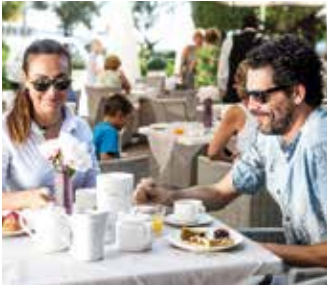
SOPIRA DALL'ALTO IN PISCINA, COLAZIONE ALL'APERTO. SOTTO UNA CAMERA VISTA MARE