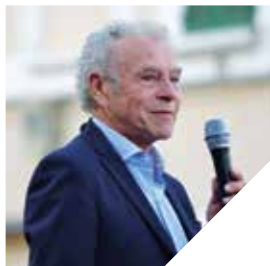
Massimo Medri, Sindaco di Cervia