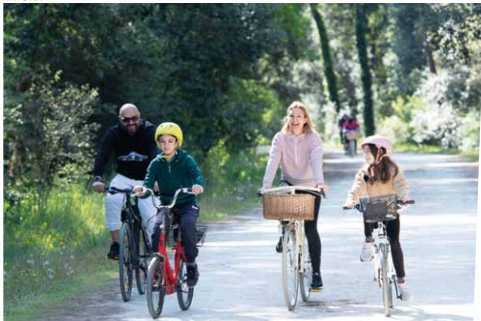
SOPRA IN BICI IN PINETA A DESTRA DENTRO AL PARCO NATURALE DI CERVIA