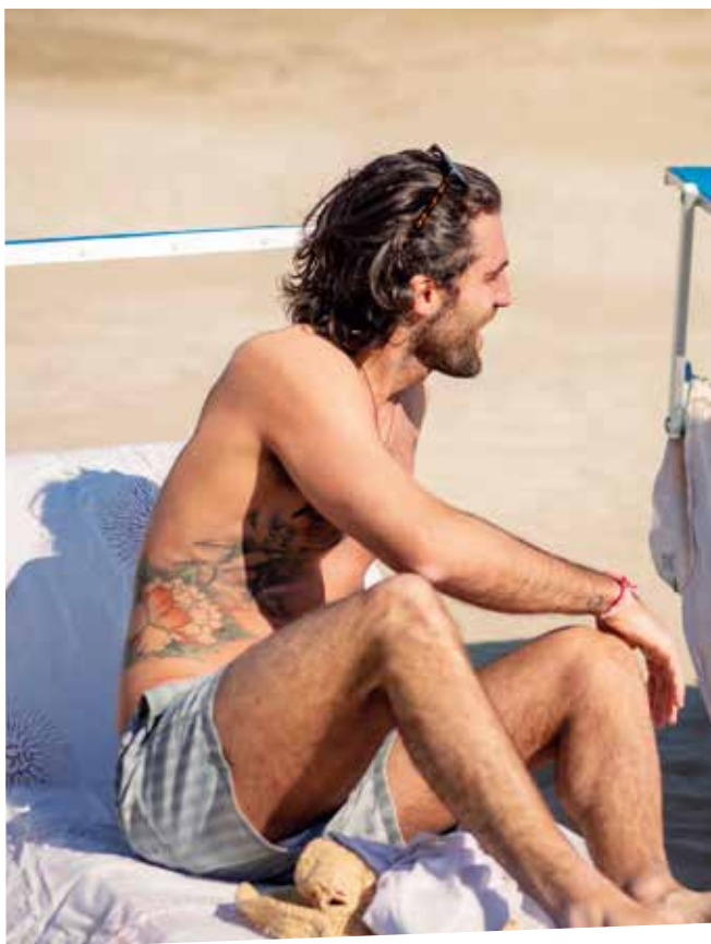
FOTO SOPRA IN SPIAGGIA SOTTO ALBA IN SPIAGGIA I MUSCONI IN ALTO A DESTRA

C'è l'imbarazzo della scelta per gli sportivi che scelgono le spiagge di Cervia per le loro vacanze. Partiamo con gli sport acquatici: oltre a windsurf e Kitesurf, a Cervia c'è il mare giusto per praticare l'Hydrofoil, il Kitefoil Flyboard, il Surf, wakeboard, ma anche il Sup (Stand up paddle) e i corsi, decisamente originali, che sul Sup prevedono esercizi di yoga, pilates, stretching. Senza parlare dei beach sports: Cervia è la capitale del Beach Volley e del Beach Tennis, ne ospita diversi campionati tra cui i mondiali, e del triathlon con la disputa della gara più famosa, l'Ironman Italy previsto ogni anno in autunno. Altri sport sono: footvolley, beach basket, tennis su terra rossa nei campi in spiaggia. Ma soprattutto sono le