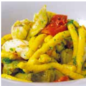
ALICI E CRUDITÈ PASSATELLI ASCIUTTI, VARIANTE DELLA TRADIZIONALE RICETTA IN BRODO