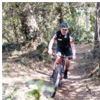
ADRIATIC GOLF CLUB [PH. DANY FONTANA] IRONMAN CERVIA [PH. GETTY IMAGES] AQUILONI [GIORGIO CARLONI] RICI IN PINETA [PH. SIMONE MANZO] SOTTO VELE STORICHE [PH. CHRISTIAN ZANOTTI]